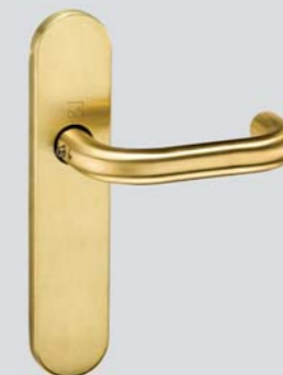
Длинная планка MS5L800CUM

Ручка Sena матовая на розетке D50 из антибактериального сплава.