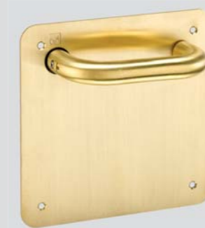
Квадратная планка MS5C800CUM

Ручка из антибактериального сплава диаметром 20 или 30 мм